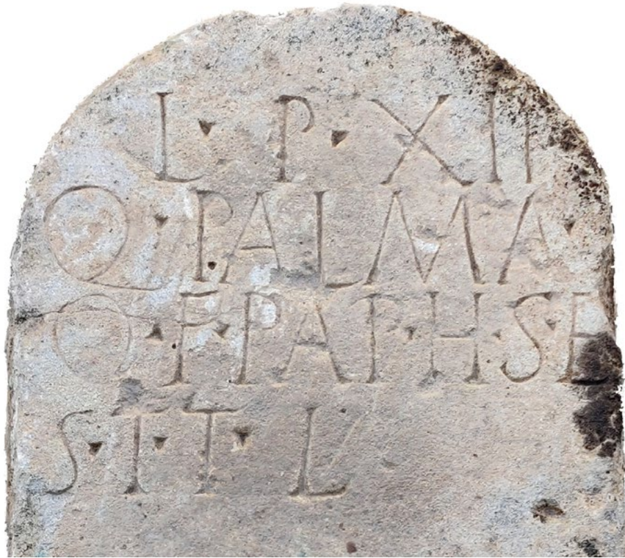
Figura 3. Estela de Q. Palma: detalle del campo epigráfico.