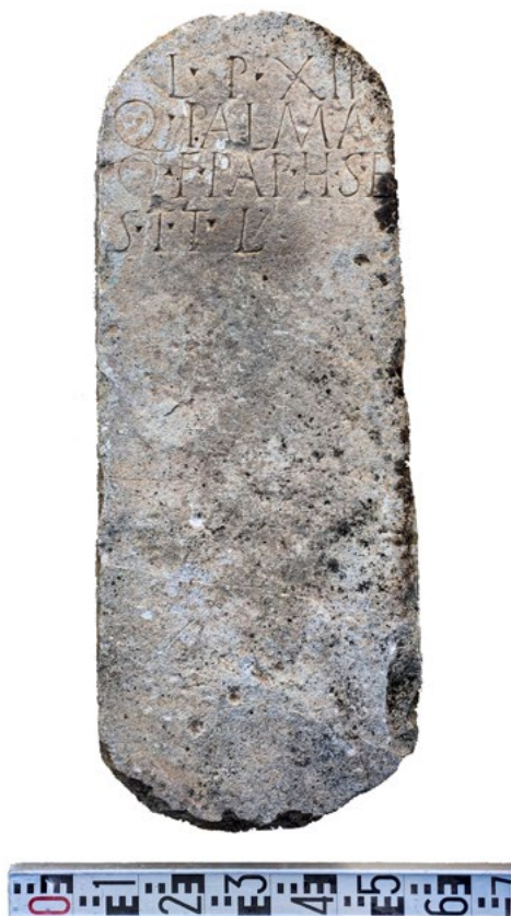
Figura 2. Estela funeraria de Q. Palma. Museo Histórico Municipal de Écija.

Las medidas son: altura, 106 cm; anchura, 39 cm; grosor, 21 cm. La proporción anchura/altura de la estela es por lo tanto de 1:2,71.