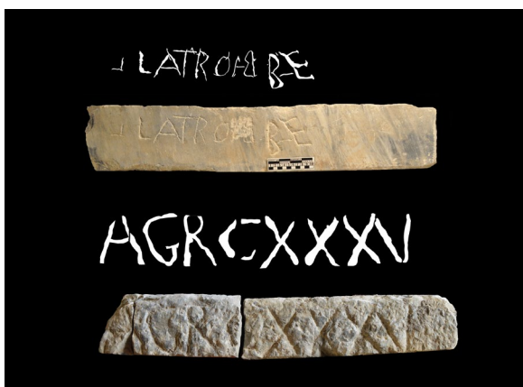
Figura 6. Las dos notae lapicidinarum recuperadas en el teatro de Gades.

Parece razonable pensar que la inscripción se realizó en la propia cantera una vez cortada la placa con la serra , a juzgar por el correcto ajuste del texto a la escasa superficie disponible. Un paralelo muy cercano para esta nota lo encontramos en el teatro romano de Carthago Nova , inaugurado entre los años 5 y 1 a. C. En la cara inferior toscamente desbastada de una placa perteneciente también al pluteus , esta vez elaborado con la variedad blanca de Carrara, figura el texto: TV XXXIII (Soler, 2020, p. 170 y fig. 12) 5 .