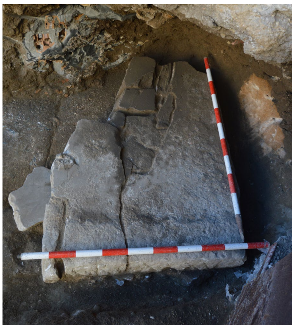
Figura 4. Momento de extracción de la placa con nota AGR.

Durante la campaña de 2017 se liberó todo el espacio existente entre la zona de la orchestra , excavada por la Universidad de Cádiz en 2011 (Borrego y Rodríguez, 2012; Bernal et al. , 2014), y las primeras filas del graderío. Asimismo, se excavó el intradós de los arcos de descarga de los edificios colindantes, siendo durante el desarrollo de esta actividad, bajo el Arco 1, cuando volvió a aparecer la pieza de balteus ya vista en años anteriores. Decidida su extracción, se excavó el perfil hasta liberarla por completo, se numeraron los fragmentos que la componían y se almacenaron con el resto de materiales arqueológicos recuperados en dicha campaña (Borrego, 2020) (Fig. 4).