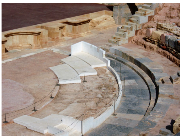
Figura 3. Colocación de las placas del pluteus de la prohedria en el teatro romano de Cartagena.

Durante la campaña de 2017 se liberó todo el espacio existente entre la zona de la orchestra , excavada por la Universidad de Cádiz en 2011 (Borrego y Rodríguez, 2012; Bernal et al. , 2014), y las primeras filas del graderío. Asimismo, se excavó el intradós de los arcos de descarga de los edificios colindantes, siendo durante el desarrollo de esta actividad, bajo el Arco 1, cuando volvió a aparecer la pieza de balteus ya vista en años anteriores. Decidida su extracción, se excavó el perfil hasta liberarla por completo, se numeraron los fragmentos que la componían y se almacenaron con el resto de materiales arqueológicos recuperados en dicha campaña (Borrego, 2020) (Fig. 4).