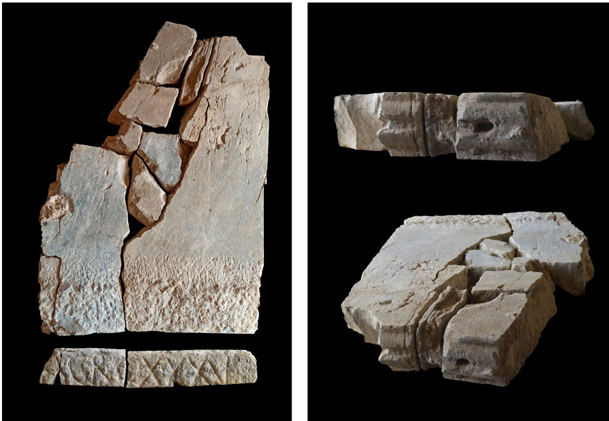
Figura 5. Placa con nota AGR: vista del frente, base inscrita y dorso con pasamanos y grapa de reparación.

cara inferior, que no era vista una vez instalada la pieza, muestra una superficie tosca fruto de la caesura del bloque en cantera. Aquí, con letras de 11-12 cm de altura y ejecución grosera a puntero, se conserva la nota lapicidinarum con el siguiente texto (Fig. 6, abajo):