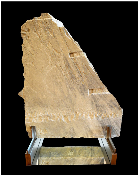
Figura 2. Placa de pluteus con nota BAE.

lapicidinarum son bien conocidas, tanto en bloques de extracción o semielaborados como en materiales puestos en obra (Paribeni y Segenni, 2003, 2015b, p. 400; Pensabene, 2004; Letta, 2015, p. 428; Gregori, 2016, p. 886; Paci, 2017, p. 506).