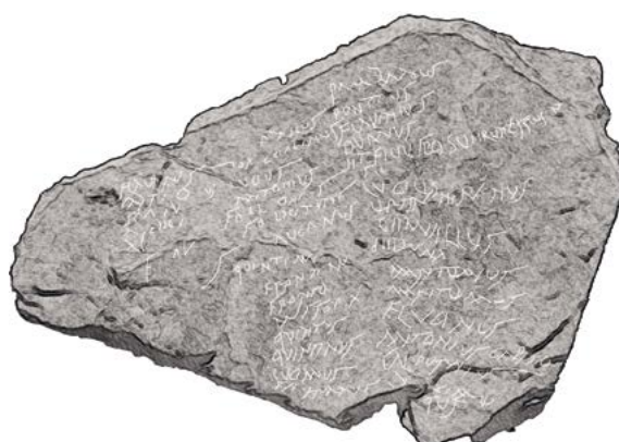
Figura 3. Fotografía y restitución del texto epigráfico (Villa 2016: 26-27).