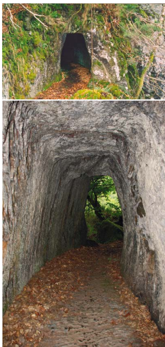
Figura 5. Canales de distribución de agua de Peña Furada (sup. J. Sánchez-Palencia e inf. Villa 2009).

con el sentido de que Duavus et filius aportaron su fuerza de trabajo en el desempeño de extraer roca o mineral. De hecho, para Varrón, fruges se relaciona con cualquier tipo de recurso que proporciona la tierra ( Ling. , 5, 104). Más explícito es todavía Tácito, quien utiliza fruges para recordar la gran entrada del oro extraído en los metalla imperiales para el año 60 d. C.: Non enim solitas tantum fruges nec confusum metallis aurum gigni, sed nova ubertate provenire terram (Tac. Ann. , 16, 2, 2). Sin duda esta terminología entra en consonancia con la huella indeleble que han dejado en el paisaje las labores de acondiciona-