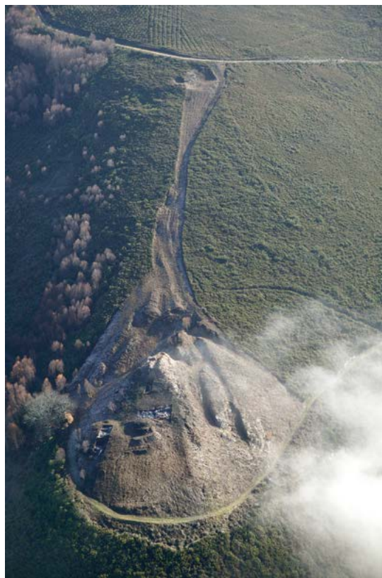
Figura 2. Fosos y depósito minero asociado a Pelóu (Montes et alii 2009: 315).

En la etapa romana alto-imperial (fase 3) se han registrado dos hogares en el interior del recinto (C-1 y C-3), el vial de acceso y una posible remodelación del perímetro fortificado, que presenta una constricción del espacio interno frente al periodo precedente, como refleja la superposición de la atalaya sobre una de las cabañas del nivel inferior de ocupación. Las razones de esta disminución del espacio habitado se desconocen, pero resultan en cualquier caso sorprendentes si tenemos en cuenta el ya de por sí pequeño tamaño del asentamiento en época prerromana. El resto de testimonios asignables a esta época han confirmado la presencia de personal militar en el castro como ya había suponer por su entorno minero inmediato, en cumplimiento de las necesarias funciones técnicas y de supervisión en las explotaciones auríferas cercanas. En esta dirección, se han documentado piezas de armamento militar datadas en el siglo I d. C., como un puñal de antenas forjado en hierro con empuñadura de bronce (Villa 2009a, nº 60: 250-251), además de otro afalcatado con hoja de hierro y empuñadura de bronce datado en el siglo I d. C. (Villa 2009a, nº 62: 254-255). También un gancho y una cadena de bronce