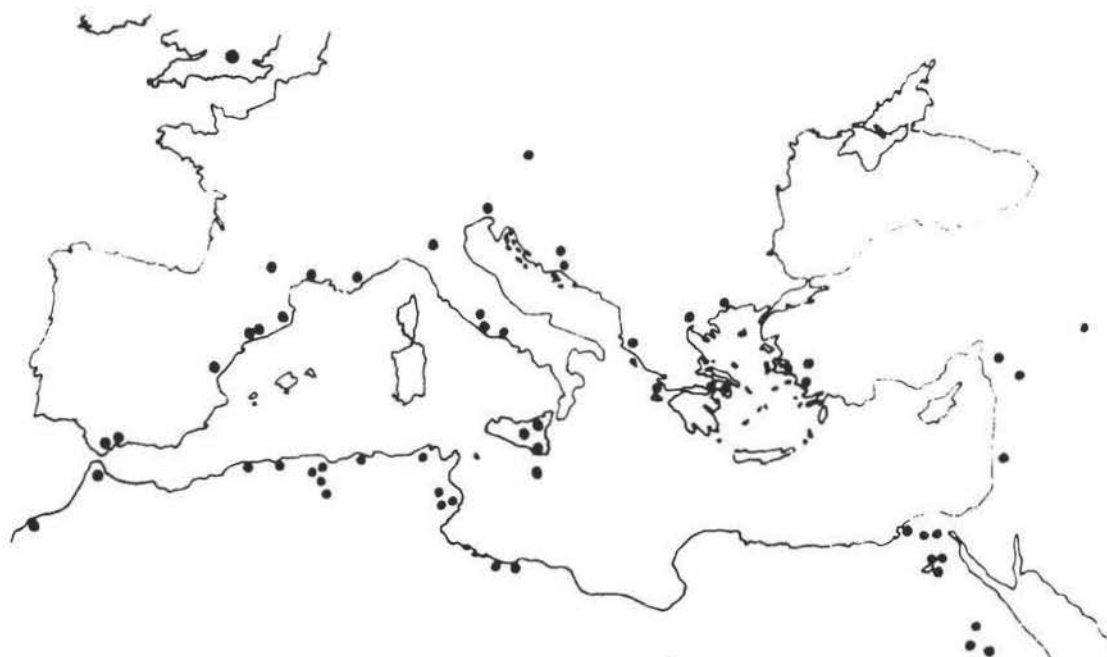
Figura 2.— Mapa de la distribución de la sigillata africana C con decoración aplicada (según Hayes 1972, modificado).

cms., siendo su anchura máxima de 0,4 cms. La pasta es de color rosado, dura y de fractura bastante rectilínea. El englobe se extiende (al menos en el fragmento conservado; ignoramos si era así o no en el plato completo) tanto por el interior como por el exterior de la pieza.